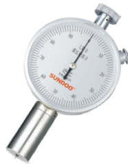
邵氏D型指针式硬度计