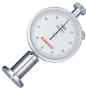
邵氏AO型指针式硬度计